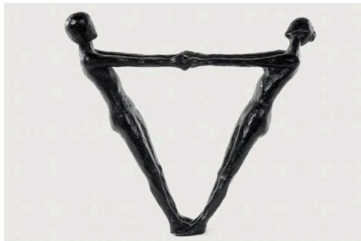
Les âmes sœurs', Healy